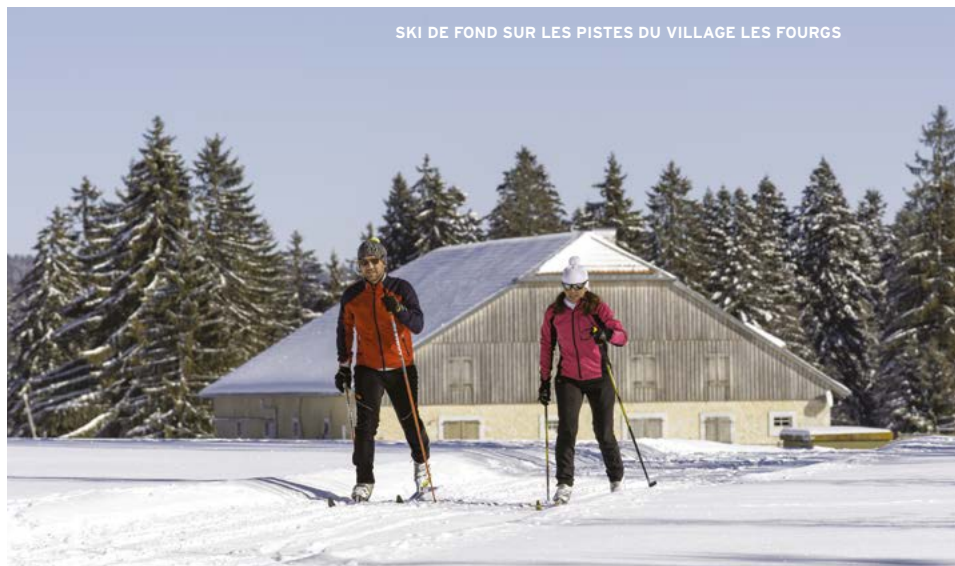
SKI DE FOND SUR LES PISTES DU VILLAGE LES FOURGS