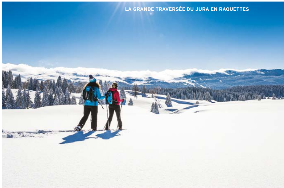
LA GRANDE TRAVERSÉE DU JURA EN RAQUETTES

Véritable station de sports d'hiver, la Station des Rousses offre toutes les conditions nécessaires pour un séjour à la neige réussi. Grande diversité des activités : ski de fond, raquettes à neige, chien de traîneau, ski joëring, pistes de luge, espaces ludique, initiation au biathlon, ski de descente... la liste est longue ! Le tout, accompagné d'un panel de services et commerces de proximités qui rendront le séjour agréable et confortable.