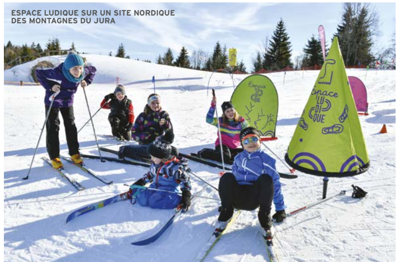
ESPACE LUDIQUE SUR UN SITE NORDIQUE DES MONTAGNES DU JURA

En plein cœur des Montagnes du Jura, partez à la découverte des paysages fabuleux dignes du Grand Nord canadien. Ici, c'est le royaume des grands espaces et du ski de fond mais aussi une succession de petits villages bordés de forêts d'altitudes, d'alpages enneigés et de lacs gelés. Au détour d'un chemin, vous pourrez apercevoir les attelages de chiens de traîneaux qui s'entraînent.